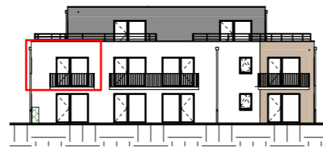
Façade Ouest - Échelle au 1/400ème

NOTA : Ces plans de vente ont été extraits du dossier de permis de construire. Les plans techniques d'exécution seront réalisés ultérieurement et feront figurer les implantations électriques ainsi que les radiateurs. Des modifications et des ajustements techniques sont susceptibles de faire évoluer les plans. Les éléments de mobilier (meubles, appareils ménagers et plan de travail) ne sont placés qu'à titre indicatif