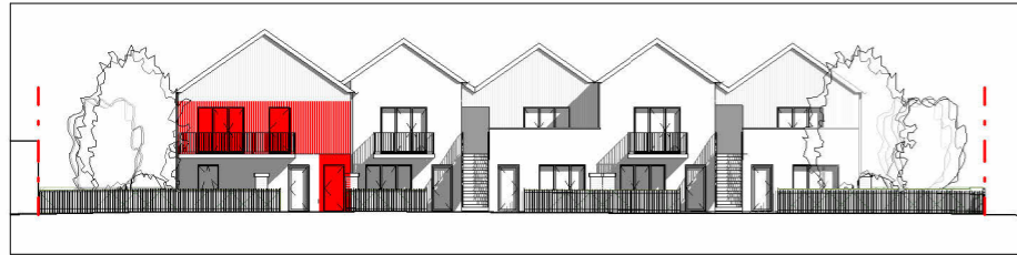
Façade Sud-Est 1 : 400