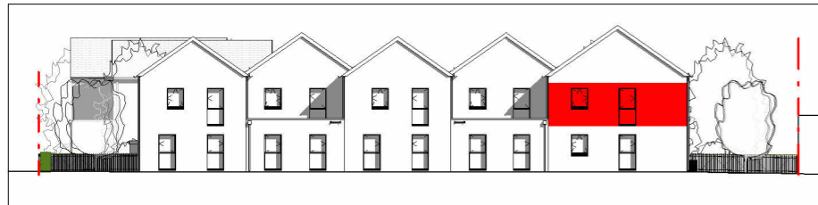
Façade Nord-Ouest 1 : 400