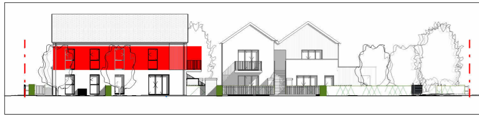
Façade Sud-Ouest 1 : 400