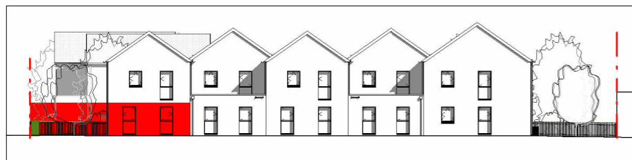
Façade Nord-Ouest 1 : 400