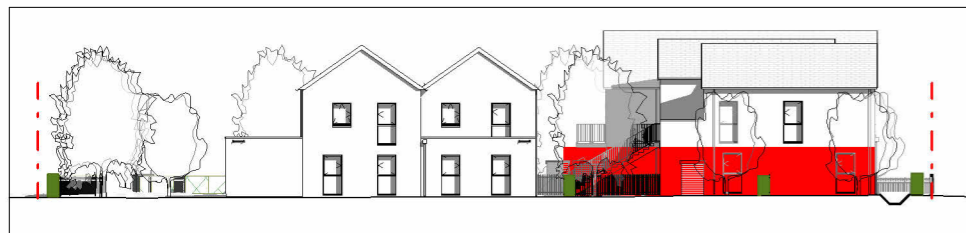
Façade Nord-Est 1 : 400