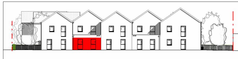
Façade Nord-Ouest 1 : 400

NOTA: Ce plan est édité en cours de chantier. En raison d'impératifs techniques, des adaptations mineures sont susceptibles de faire évoluer ce plan. Les poutres, poteaux, soffites, canalisations et faux-plafonds n'apparaissent pas systématiquement. Les meubles et éléments de cuisine ne sont qu'indicatifs.