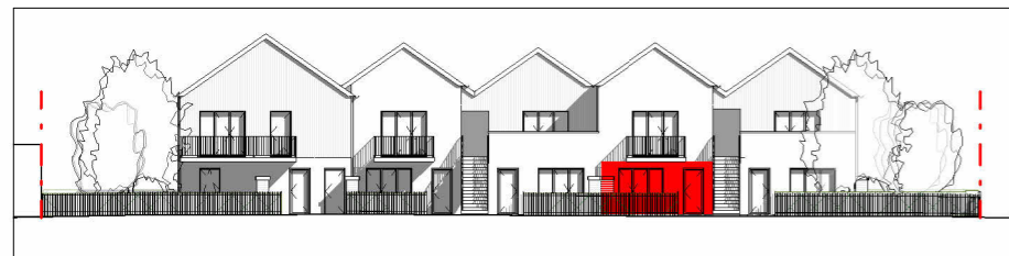
Façade Sud-Est 1 : 400