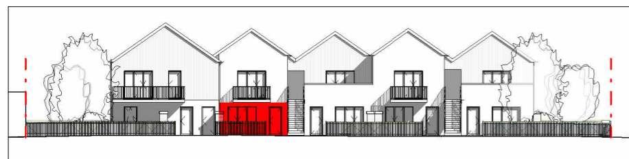
Façade Sud-Est 1 : 400