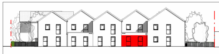
Façade Nord-Ouest 1 : 400