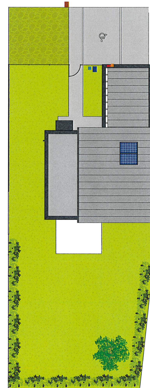
Plan Masse 1 : 200