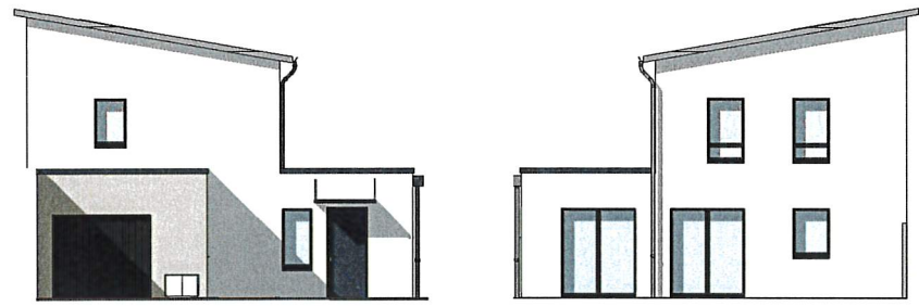
Façade Nord 1 : 200 Façade Sud 1 : 200