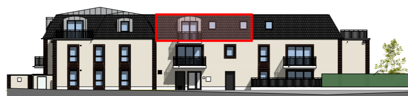
Façade Nord - 1/400