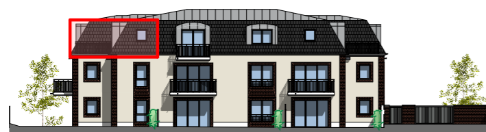
Façade Est - 1/400