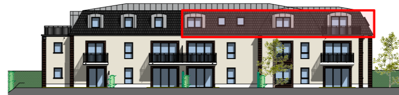
Façade Sud - 1/400