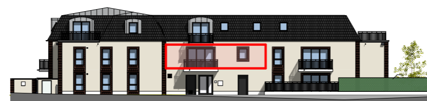
Façade Nord - 1/400

NOTA (phase notaire) : ce plan est édité en phase de préparation ou en cours de chantier. En raison d'impératifs techniques de réalisation, des modifications sont susceptibles de faire évoluer ce plan. Les poutres, poteaux, soffites, canalisations et faux plafonds n'apparaissent pas systématiquement. Les radiateurs ne sont pas figurés. Les meubles et éléments de cuisine ne sont qu'indicatifs. Seuls seront fournis les équipements figurant dans la notice descriptive annexée à la vente.