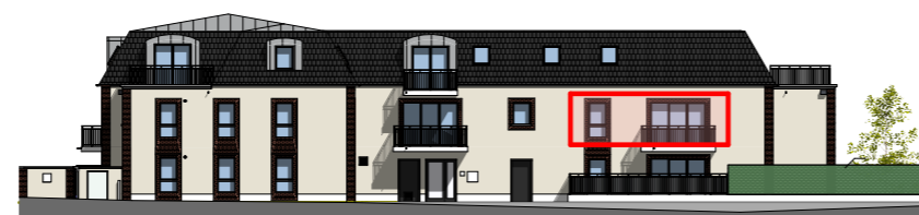
Façade Nord - 1/400