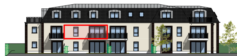
Façade Sud - 1/400