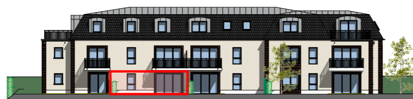
Façade Sud - 1/400