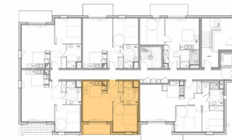
Plan de situation