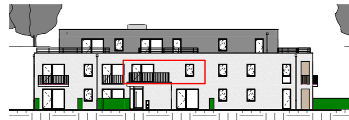
Façade Ouest - 1/400