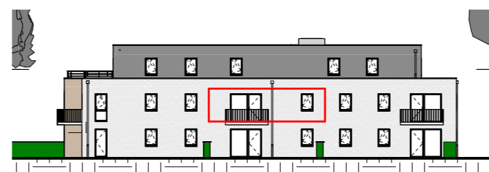
Façade Est - 1/400