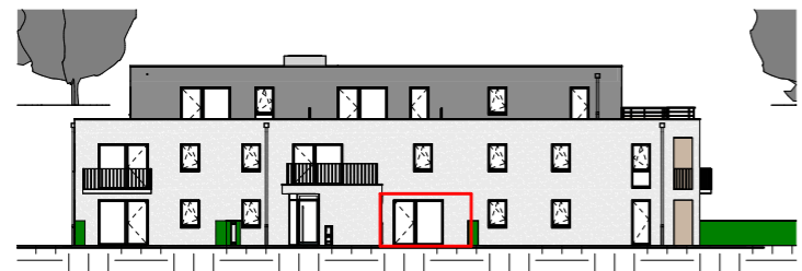
Façade Ouest - 1/400

NOTA : Ces plans de vente ont été extraits du dossier de permis de construire. Les plans techniques d'exécution seront réalisés ultérieurement et feront figurer les implantations électriques ainsi que les radiateurs. Des modifications et des ajustements techniques sont susceptibles de faire évoluer les plans. Les éléments de mobilier (meubles, appareils ménagers et plan de travail) ne sont placés qu'à titre indicatif