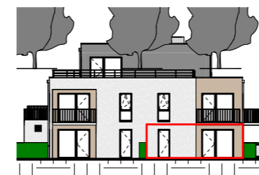
Façade Sud - 1/400