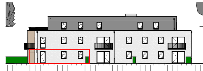
Façade Est - 1/400