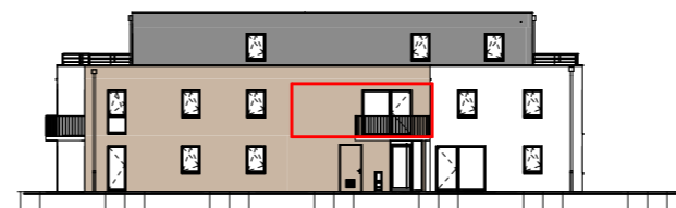
Façade Est - 1/400