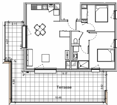
Plan terrasse - 1/200