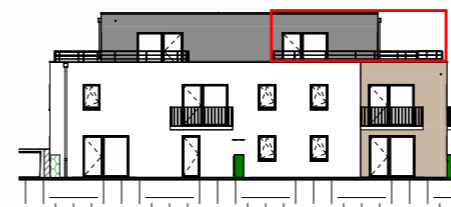
Façade Ouest - 1/400