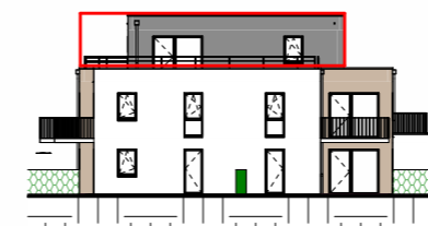
Façade Sud - 1/400