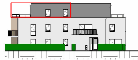
Façade Est - 1/400