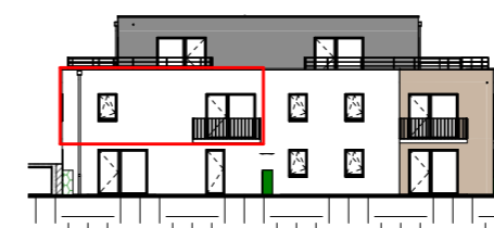
Façade Ouest - 1/400