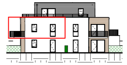
Façade Sud - 1/400