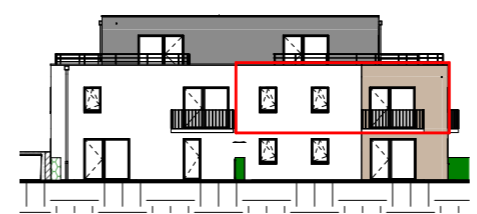
Façade Ouest - 1/400