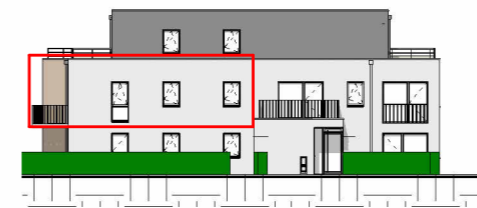
Façade Est - 1/400