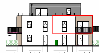
Façade Sud - 1/400