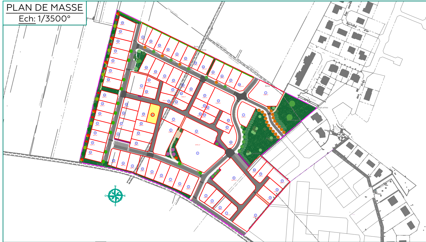
PLAN DE MASSE Ech: 1/3500°